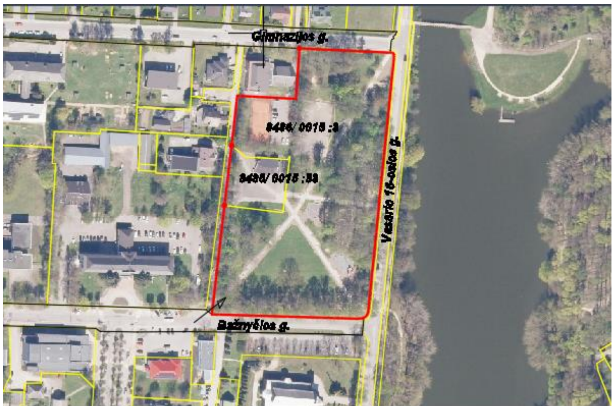
5 pav. formuojamas sklypas

Patekimas į formuojamą sklypą- iš Bažnyčios g. esama nuovaža, bendro naudojimo keliu. Planuojamos teritorijos sprendiniai nekeičia esamos teritorijos susisiekimo sistemos.